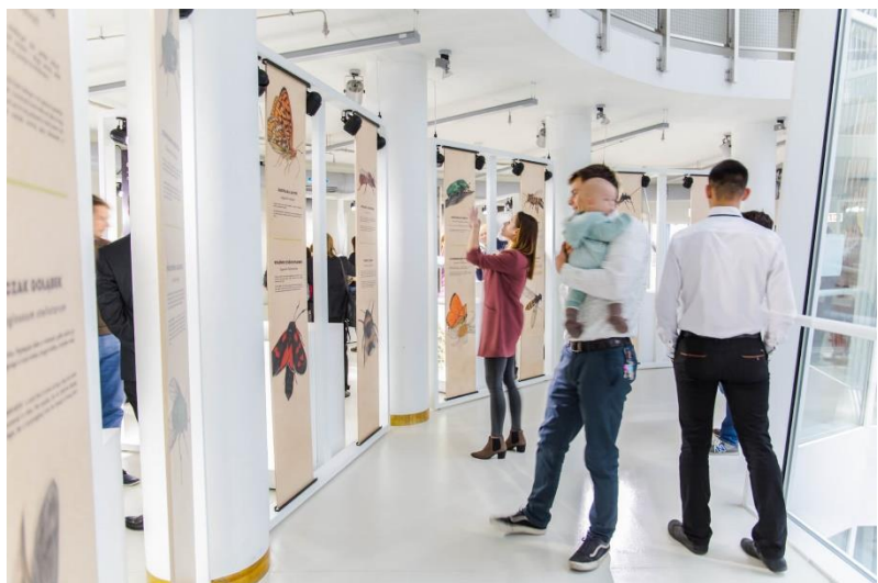
U góry: Przestrzeń Tajemnica pyłków

Zapraszamy bliżej gwiazd, do Strefy Głębokiego Kosmosu , w której odwiedzający dowiedzą się jak wygląda praca astronautów na Międzynarodowej Stacji Kosmicznej (ISS) oraz jak wygląda nasza planeta spoglądając przez Cupolę, czyli specjalne okno zamontowane w stacji kosmicznej.