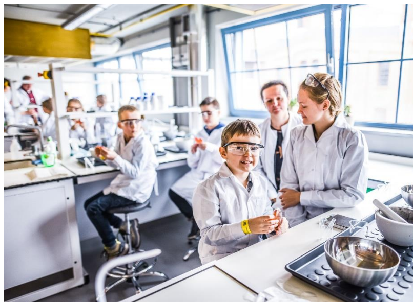
U góry od lewej: Kino Sferyczne, Laboratorium Po prawej: Ulica Żywiotów