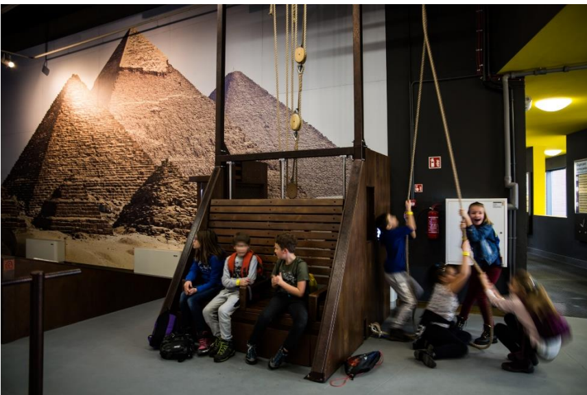
Po lewej: Ścieżka Rozwój wiedzy i cywilizacji

Wystawa ukazuje jak nierozzerwalnie postęp cywilizacyjny wiąże się i zależy od odkrywania przez człowieka kolejnych praw rządzących otaczającym nas światem. Przemierzając ścieżkę można zobaczyć zorzę polarną, poznać zasadę działania radia, zostać kierownikiem elektrowni atomowej, czy prześwietlić bagaż promieniami rentgenowskimi.